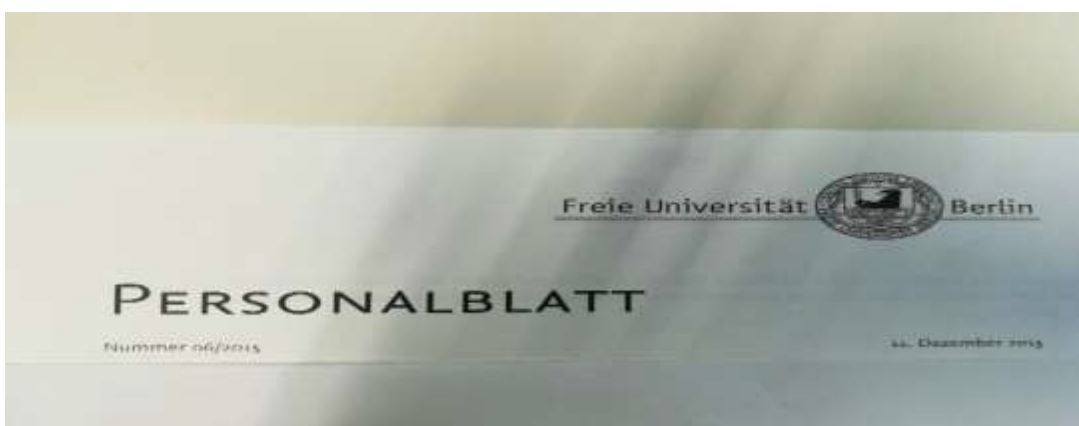
Briefbögen sind im CD Design zu verwenden, alle Mitarbeiter haben Zugriff darauf