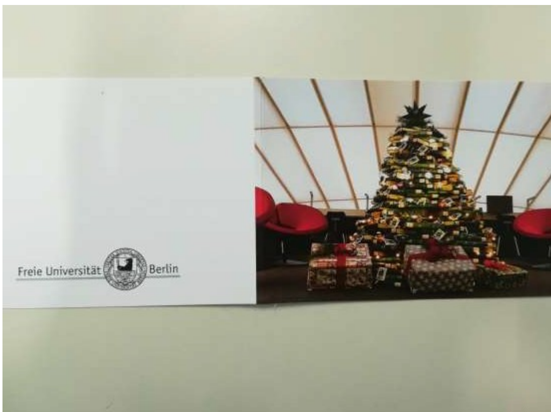
diesjährige Weihnachtspostkarte, sowie Postkartenset mit Aufnahmen der Bibliothek