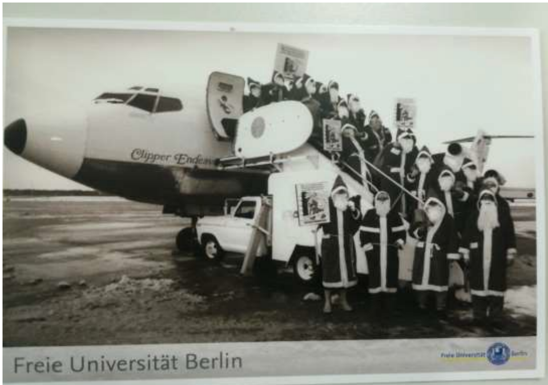
diese Postkarte gibt es im hiesigen "Uni-Shop" der FU zu erwerben