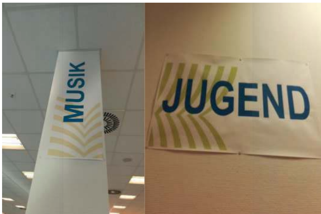
Wiedererkennung des Logos am Leitsystem, allerdings wird dies nicht in der ganzen Bibliothek vollzogen, Regalbeschriftungen sind ohne CD gestaltet