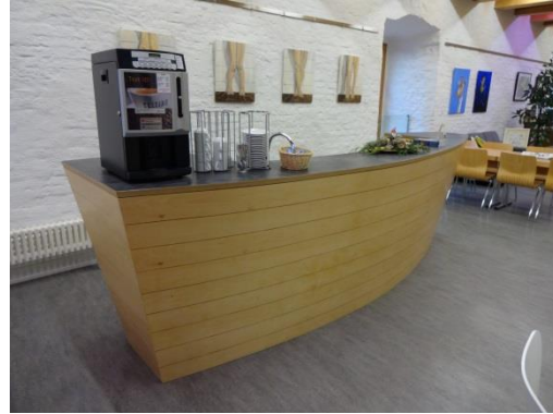
Stilisiertes Schiff im Lesecafé

Dies ist zum einen der „Baum“ in der Kinderabteilung, der seit ca. 2 Jahren die Blicke auf sich zieht. Aktuell ist er weihnachtlich mit Lichterkette geschmückt, im Sommer trägt er grüne Blätter, im Herbst orange. Zum anderen ist es die Theke im Lesecafé, die aussieht wie ein „Schiff“ und eine Verbindung zum nahe gelegenen Donauufer herstellen soll.