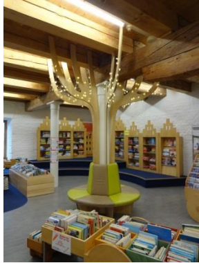
Stilisierte Baum in der Kinderabteilung

Als ich vom „Wow“- und „Oomph“-Effekt gelesen habe, sind mir für die Straubinger Bibliothek direkt zwei Dinge eingefallen: