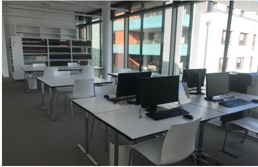
Abbildung 7: Arbeitsplätze