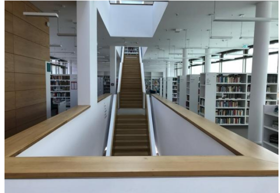
Abbildung 4: Erste Etage mit Belletristik