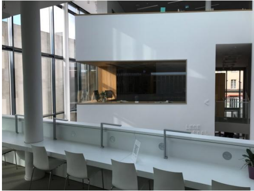
Abbildung 3: Lesesaal

letristik, Hörbücher, Film- und Zeitschriftenabteilung platziert. In der zweiten Etage befindet sich der Fachbuchbereich und die Jugendbibliothek.