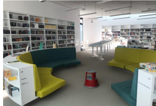
Abbildung 6: Jugendbereich