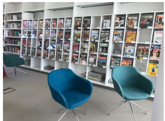
Abbildung 5: Sitzplätze

Sitzmöglichkeiten wurden im gesamten Gebäude geschaffen und dienen unterschiedlichen Anforderungen. Zum einen laden die Sitzbereiche im Foyer zur Kommunikation ein, während die Bereiche in der ersten und zweiten Etage zum Arbeiten konzipiert sind. Alle Möbel sind dabei recht modern gehalten. Wirkliche Rückzugsorte gibt es in der Bibliothek nicht; schmerzlich vermisst werden von den Nutzern Sofas oder Sessel, die den Architekten jedoch nicht in das Konzept passten. Ein Lounge-Bereich wurde wohl deshalb nicht geschaffen, da diese Funktion das Café im Nebenbereich übernehmen sollte. Dies ist jedoch meiner Meinung nicht gegeben, da das Café ein kommerzieller Raum ist und nicht direkt als Bibliotheksbereich genutzt werden kann.