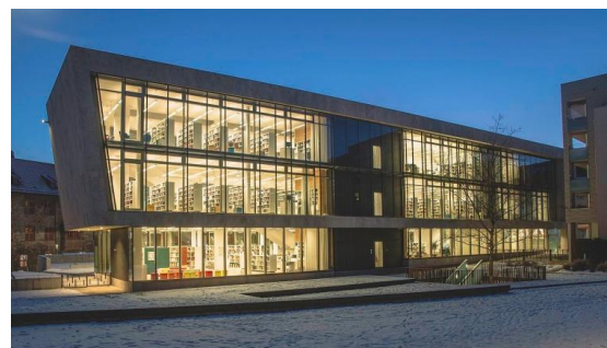
Abbildung 2: Fensterfront der Nordseite

Eine weitere Besonderheit des Baus sind die großen Fensterfassaden auf beiden Seiten, die das gesamte Haus durchziehen. Der Lesesaal dagegen ist fast fensterlos und ist durch die Front in den Bibliothekskörper hinein ein „Raum im Raum“.